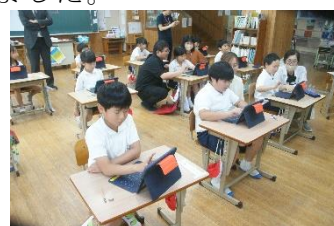
タブレットPCを活用する1・2年生

「休日の部活動の地域移行が2年目に」や「私立大学等『集中改革』」など様々なキーワードがある中で、教育ICTに関するキーワードが10のうち4つもありました。